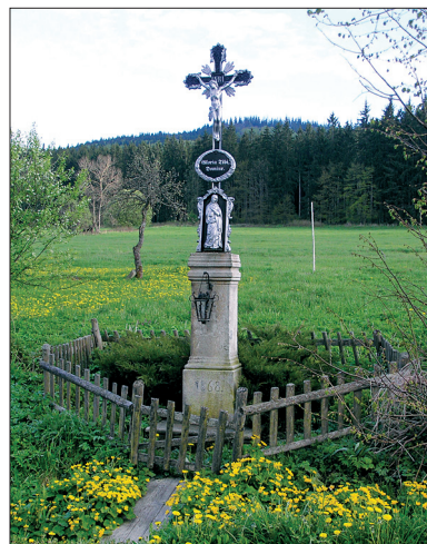
Mnohdy jen kříže a kapličky zůstaly po obyvatelích Šumavy.

M. B.: Oblast až do raného středověku takřka neosídlená, a tedy i nedotčená člověkem. Později postupně využívaná zejména jako zdroj kvalitního stavebního i rezonančního dřeva, ale i paliva pro sklárny. V postupně se rozšiřujícím bezlesí se rozvíjejí zejména louky a pastviny. Pozvolna se měnící tvář pohoří, a zejména jeho podhůří je svědkem kulturně-hospodářské „revoluce“ po odsunu původního německého obyvatelstva. Lidská aktivita téměř na 40 let ustává, desítky sídel mizejí. A dnes? Vzrůstající tlak na přírodu